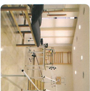
SALA DE REHABILITACIÓN