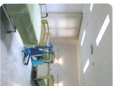
UNIDAD GERIÁTRICA ASISTENCIAL