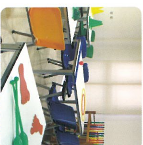
AULA DE TERAPIA OCUPACIONAL